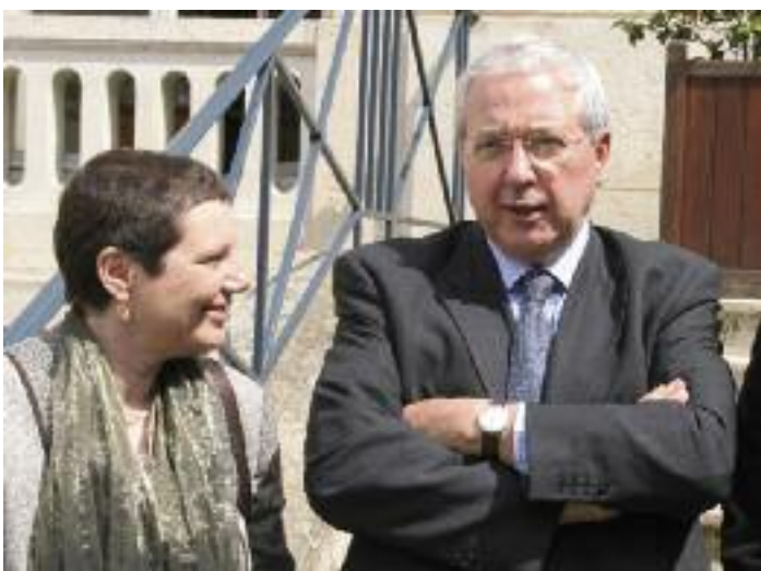
Avec Jean-Paul Huchon (Président du conseil général d'Île de France) sur la question des transports.

Présentées par le Front de Gauche - Parti Communiste Français - Parti de Gauche - Gauche Unitaire - Fédération pour une Alternative Sociale et Écologique - Convergences et Alternative... Et par des centaines de personnalités locales de gauche, écologistes, démocrates, syndicalistes, associatives... et les comités de soutien de Bagneux, Malakoff et Montrouge.